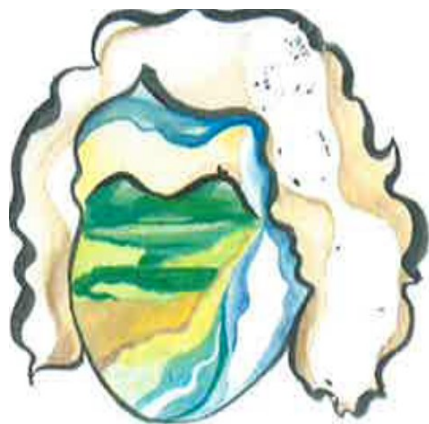
Avtorica slike: Eli Miklavčič

Kultura je tista, ki nas dela ljudi, tako edinstvene, tako posebne. To je lahko prijazen pogled, lepa beseda, pozdrav,