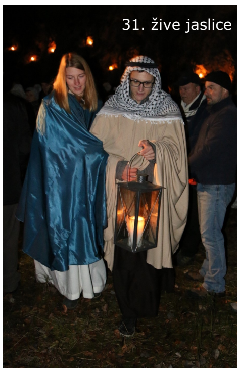
31. žive jaslice