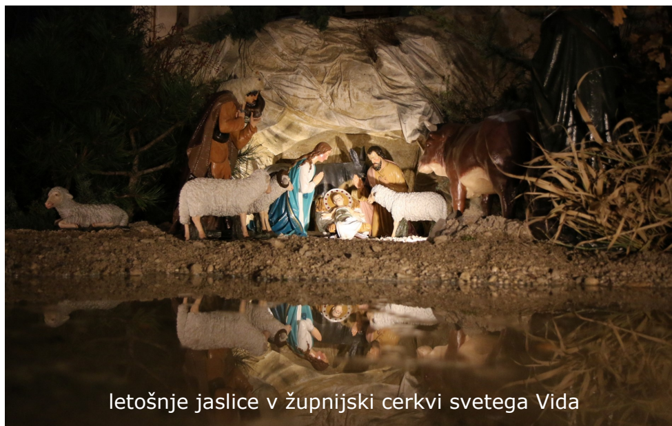
letošnje jaslice v župnijski cerkvi svetega Vida